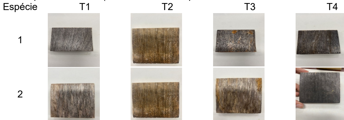
Figura 2 – Aspecto visual das madeiras após sofrerem o processo de intemperismo natural por seis meses (cada coluna corresponde a um tratamento de diferente).